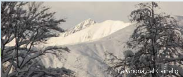
La Grigna dal Cainallo