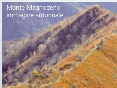
Monte Magnodeno immagine autunnale