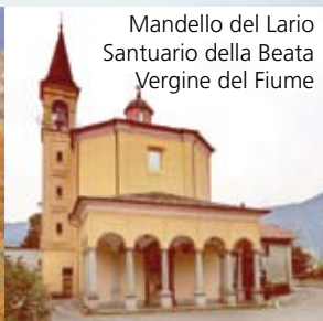
Mandello del Lario Santuario della Beata Vergine del Fiume