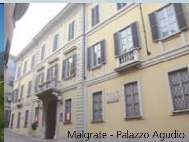
Malgrate - Palazzo Agudio