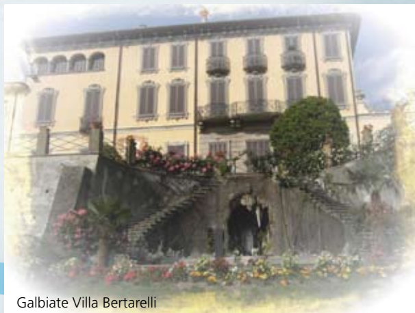
Galbiate Villa Bertarelli